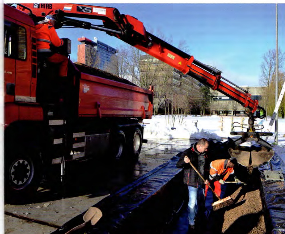
Ecologisch Waterbeheer gebruikt schelpen om hemelwater te bufferen en zuiveren.

Inge Snijder is communicatieadviseur bij VPdelta.