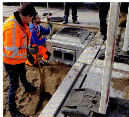
Een Bufferblock vangt tijdelijk overtollig hemelwater op.

De mannen van Mobile Dijken lieten zien dat zij snel een stabiele waterkering kunnen maken met een goede veiligheidsmarge. Het testen van hun dijk op fieldlab Flood Proof Holland was essentieel om zeker te weten dat zij deze actie goed konden volbrengen. Bon: